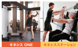
キネシス ONE キネシスステーション