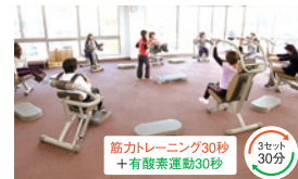
筋力トレーニング30秒 + 有酸素運動30秒 3セット 30分